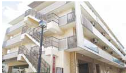
介護付有料老人ホーム クオレ東淀川 〒533-0014 大阪市東淀川区豊新 2 丁目 4-9 TEL.06(6328)1150