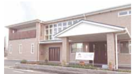
クオレ堺鳳 総合在宅センター 〒593-8326 堺市西区鳳西町 2 丁目 91-5 TEL.072(263)8826