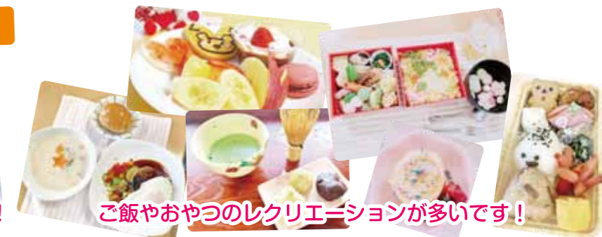
ご飯やおやつのリクリエーションが多いです!