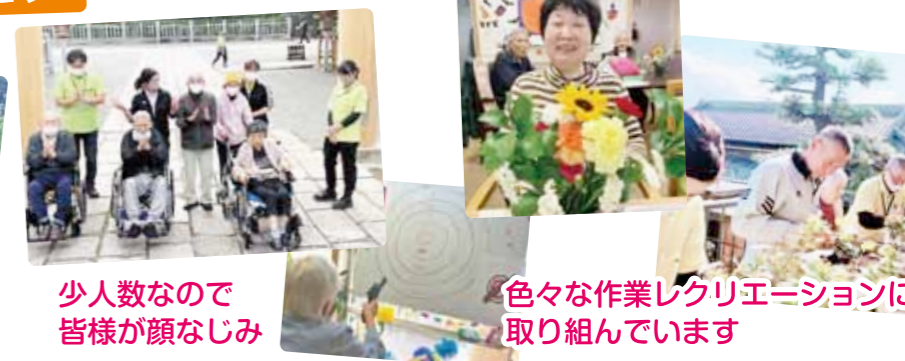
少人数なので皆様が顔なじみ