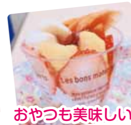
おやつも美味しい!