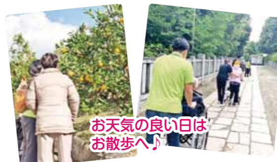
お天気の良い日はお散歩へ!